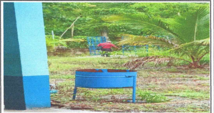
Foto 4: en la EORM aquí el mantenimiento de este portón es de carácter urgente la reparación.