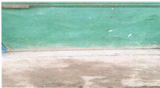
Foto 3: en la EORM es de suma importancia reparar esta lamina, por el motivo que está dañada.