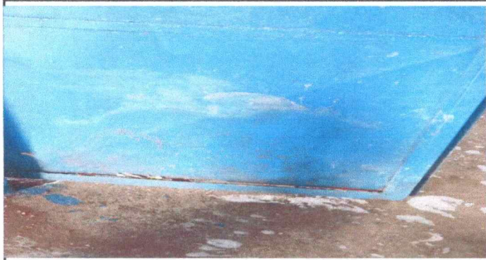
Foto1: en la EORM es de carácter urgente la reparación de esta puerta.