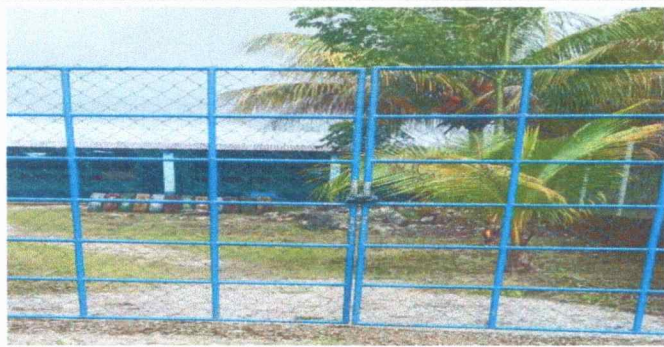
Foto 5: en la EORM en este portón es muy importante la reparación para evitar que entren personas no autorizadas.