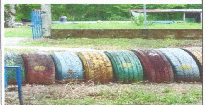
Foto 6: en la EORM ya se encuentra en pésimas condiciones: esta parte de la entrada principal.

Observación: Si es necesario se pueden agregar hojas adicionales y actualizar el número de hojas.